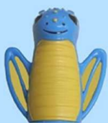
Dani il Drago